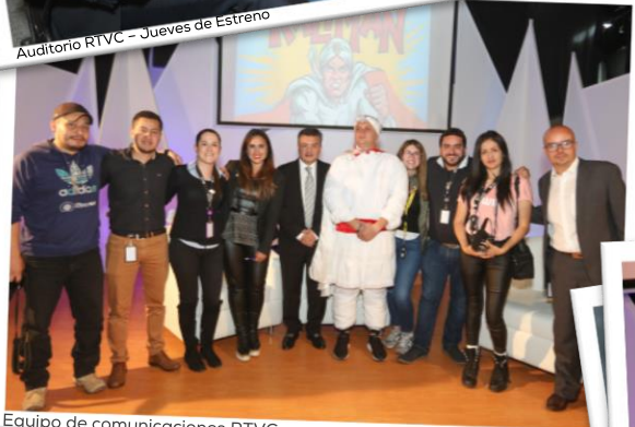
Equipo de comunicaciones RTVC