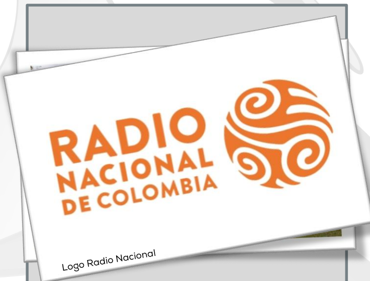
Logo Radio Nacional

#SeSupoQue del 26 al 31 de marzo Radio Nacional de Colombia, realizará el cubrimiento de la asamblea anual del Banco Interamericano de Desarrollo, BID, que este año se hará en Chengdú, China.