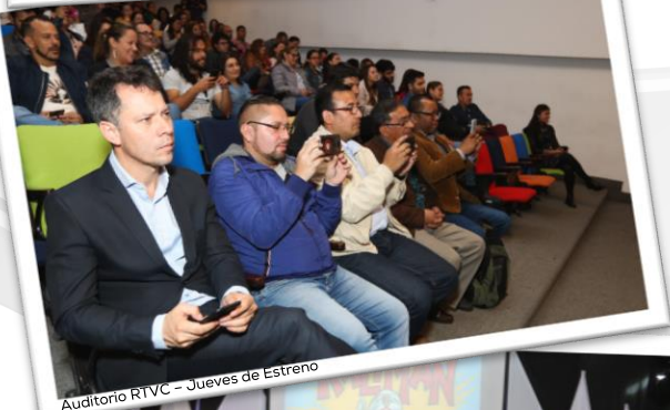
Auditorio RTVC - Jueves de Estreno

El pasado jueves 21 de marzo, regreso el JUEVES DE ESTRENO y fue un éxito total, el auditorio de RTVC estuvo lleno de colaboradores e invitados; los cuales querían enterarse de los pormenores de la donación hecha por TODELAR a SEÑAL MEMORIA.