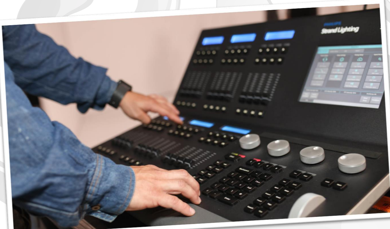
Nueva consola de Luces RTVC