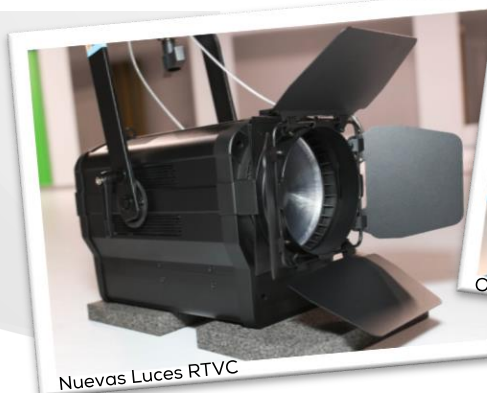
Nuevas Luces RTVC