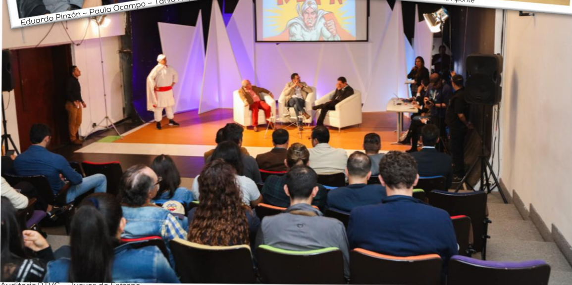
Auditorio RTVC - Jueves de Estreno