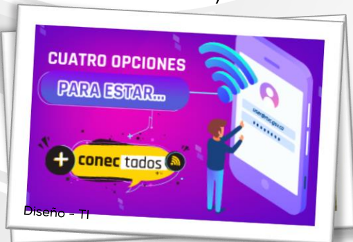
Diseño - TI

#SeSupoQue 'Bien Dateado', se sigue renovando y cambia de imagen, esta propuesta del Canal Institucional que pretende convertirse en una herramienta para fomentar la participación ciudadana y ampliar la información con los trámites relacionados con el Estado.