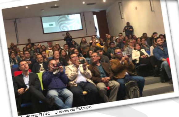
Auditorio RTVC - Jueves de Estreno