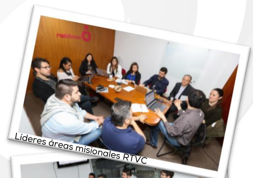
Líderes áreas misionales RTVC

Para poder cumplir con esta normatividad, las oficinas encargadas de analizar las leyes sobre este tema, buscarán diferentes estrategias para el buen uso de estos documentos y para su respectiva socialización.