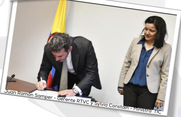
Juan Ramón Samper - Gerente RTVC y Sylvia Constain - Ministra TIC