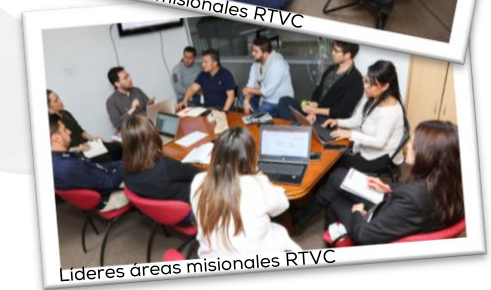
Líderes áreas misionales RTVC